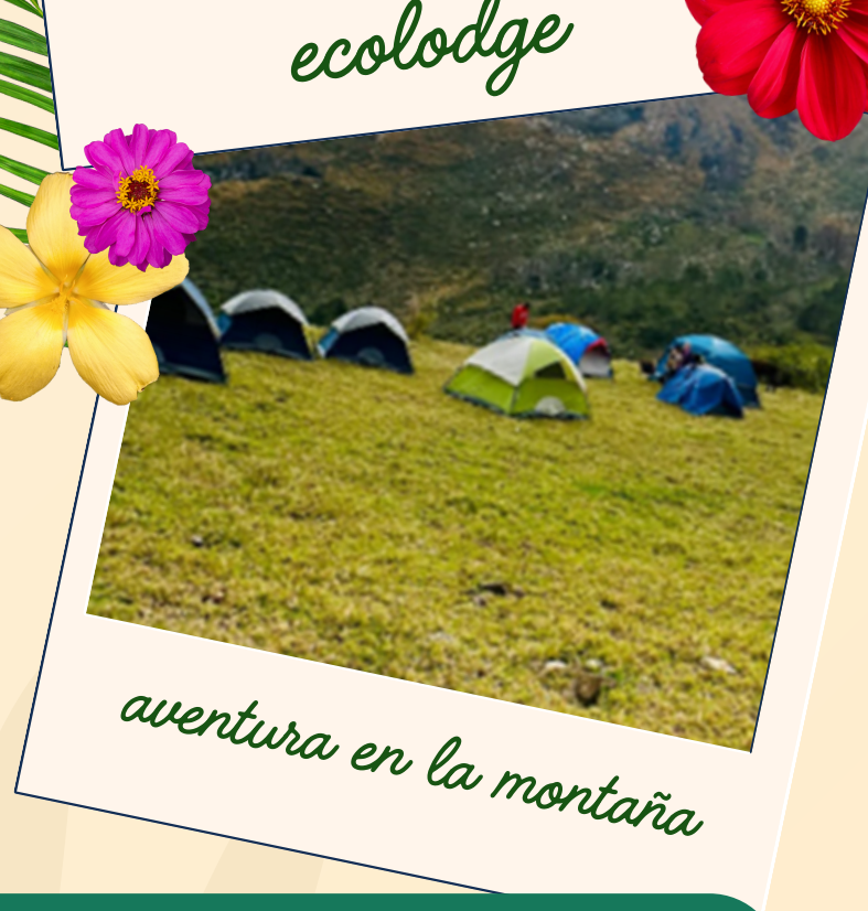
aventura en la montaña