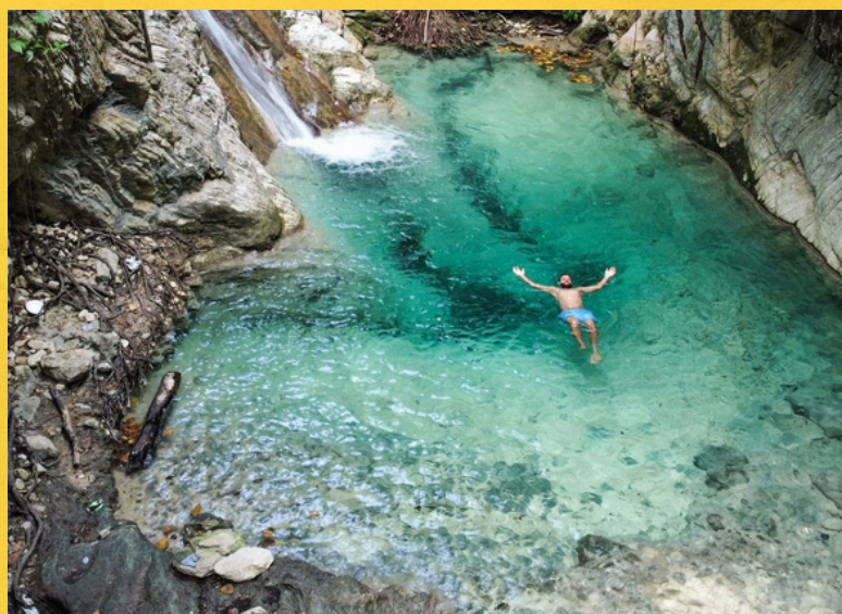
SAN JUAN DE LA MAGUANA