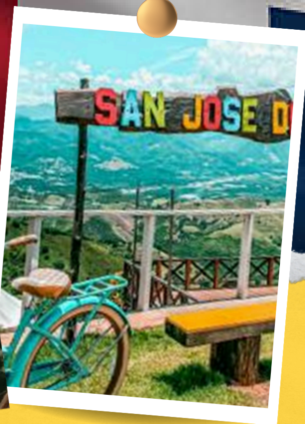
SAN JOSE DE OCOA