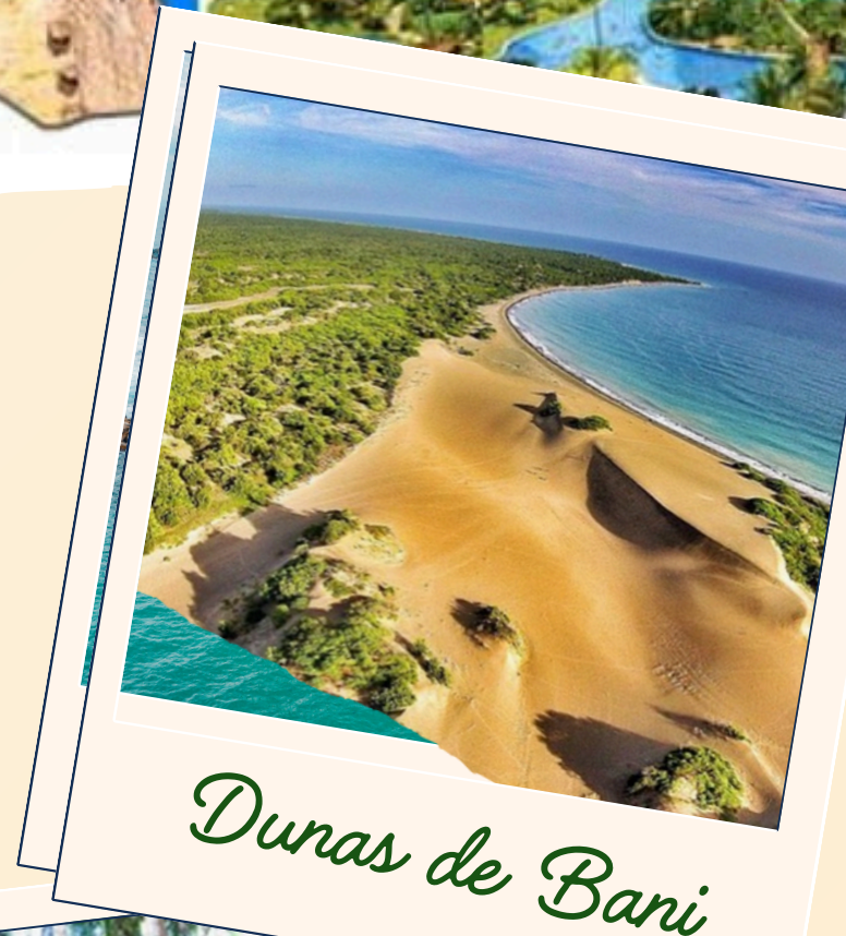
Dunas de Bani

Esta región montañosa es famosa por sus grandes elevaciones y temperaturas muy agradables en el mismo corazon de la cordillera central.