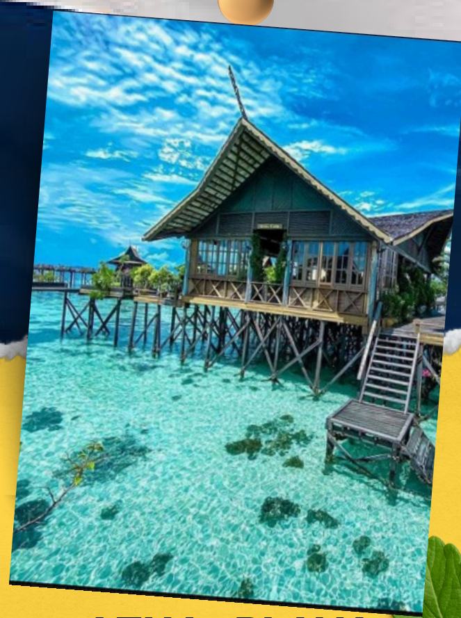
AZUA, PLAYA CARACOLES